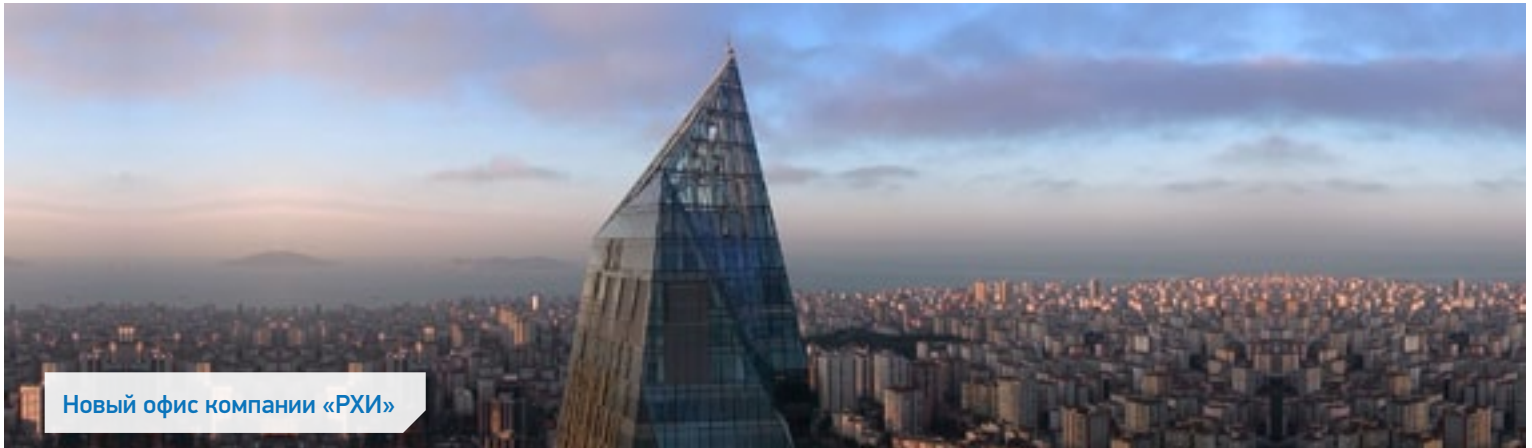
Новый офис компании «РХИ»