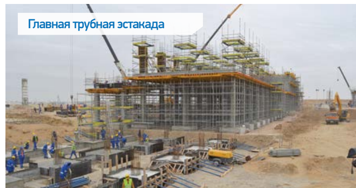
Главная трубная эстакада