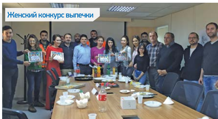
Женский конкурс выпечки