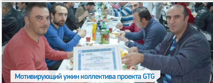
Мотивирующий ужин коллектива проекта GTG