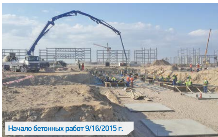
Начало бетонных работ 9/16/2015 г.