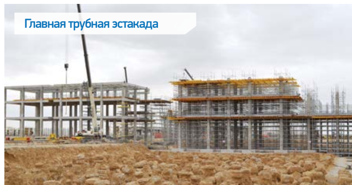
Главная трубная эстакада

конструкций. Крайне важным для компании «РХИ» является соблюдение положений и правил в области ОТ и ТБ; особая важность придается соблюдению стандартов в области сейсмостойкости и пожарной безопасности. В соответствии с графиком выполнения работ, завершение выполнения всех работ по устройству несущих бетонных конструкций запланировано на конец этого года.