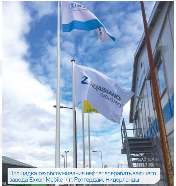
Площадка техобслуживания нефтеперерабатывающего завода Exxon Mobile / г. Роттердам, Нидерланды

Компания Ballast Nedam со своей 130-летней историей, является одной из ведущих компаний в Европе. Слияние компании Ballast Nedam с «Ренеиссанс» является не только благоприятной возможностью для «РХИ» с точки зрения освоения новых географических рынков, но