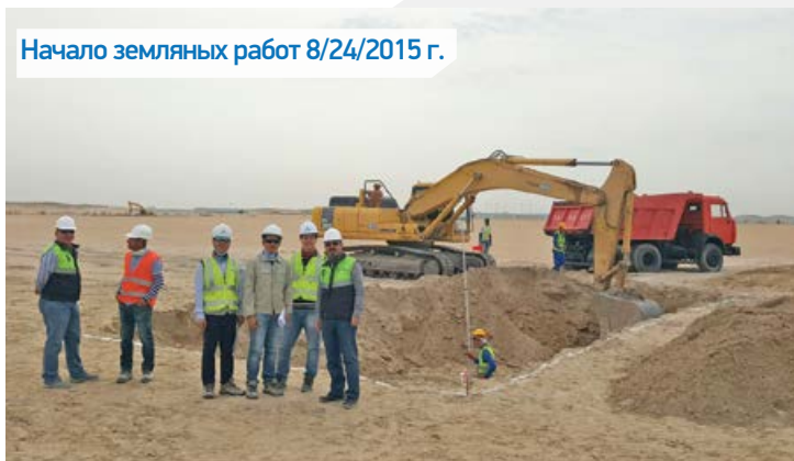
Начало земляных работ 8/24/2015 г.

Поскольку ужин был приготовлен на корейский манер, сотрудники компании «РХИ» получили несравненную возможность не только отведать блюда изысканной кухни Южной Кореи, но еще и прочувствовать превосходное гостеприимство и дружелюбие, проявленное сотрудниками компании Hyundai. Во время ужина, сотрудники обеих компаний подчеркнули и отметили прочно установившиеся и успешно развивающиеся партнерские отношения между компаниями «РХИ» и HEC, выразив надежду на тесное сотрудничество в будущем.