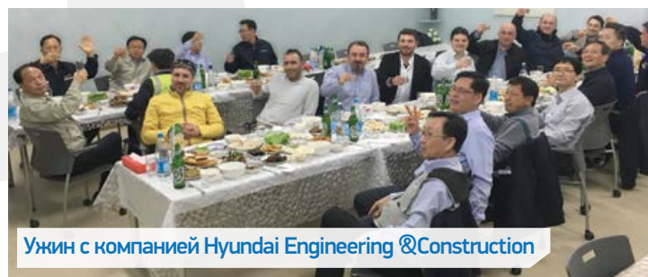
Ужин с компанией Hyundai Engineering & Construction