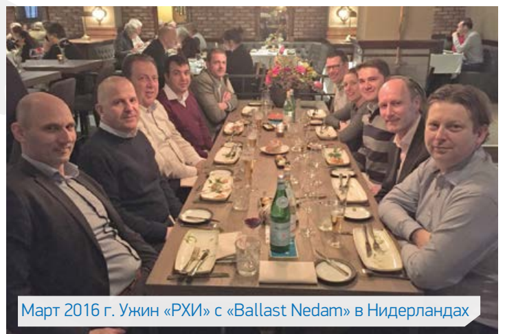
Март 2016 г. Ужин «РХИ» с «Ballast Nedam» в Нидерландах

также для расширения сферы своей деятельности. Такие проекты, как электростанции, перерабатывающие отходы, биоэнергетические электростанции, биотопливные установки и морские сооружения (Водохозяйственные комплексы) являются новыми потенциальными направлениями в работе.